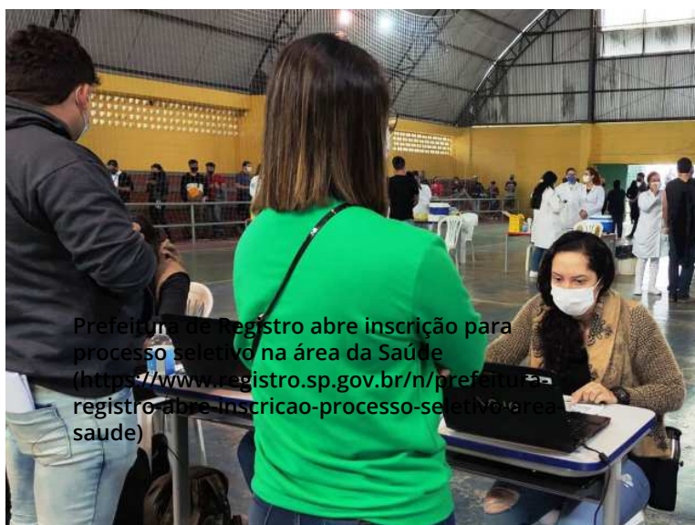
Prefeitura de Registro abre inscrição para processo seletivo na área da Saúde (https://www.registro.sp.gov.br/n/prefeitura-registro-abre-inscricao-processo-seletivo-na-area-saude)

OUVIDORIA (https://www.registro.sp.gov.br/ouvidoria.asp)